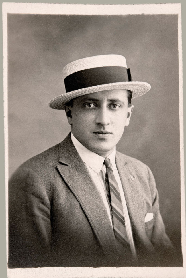
Gerardo Matos Rodríguez. Año 1917 (aprox.)