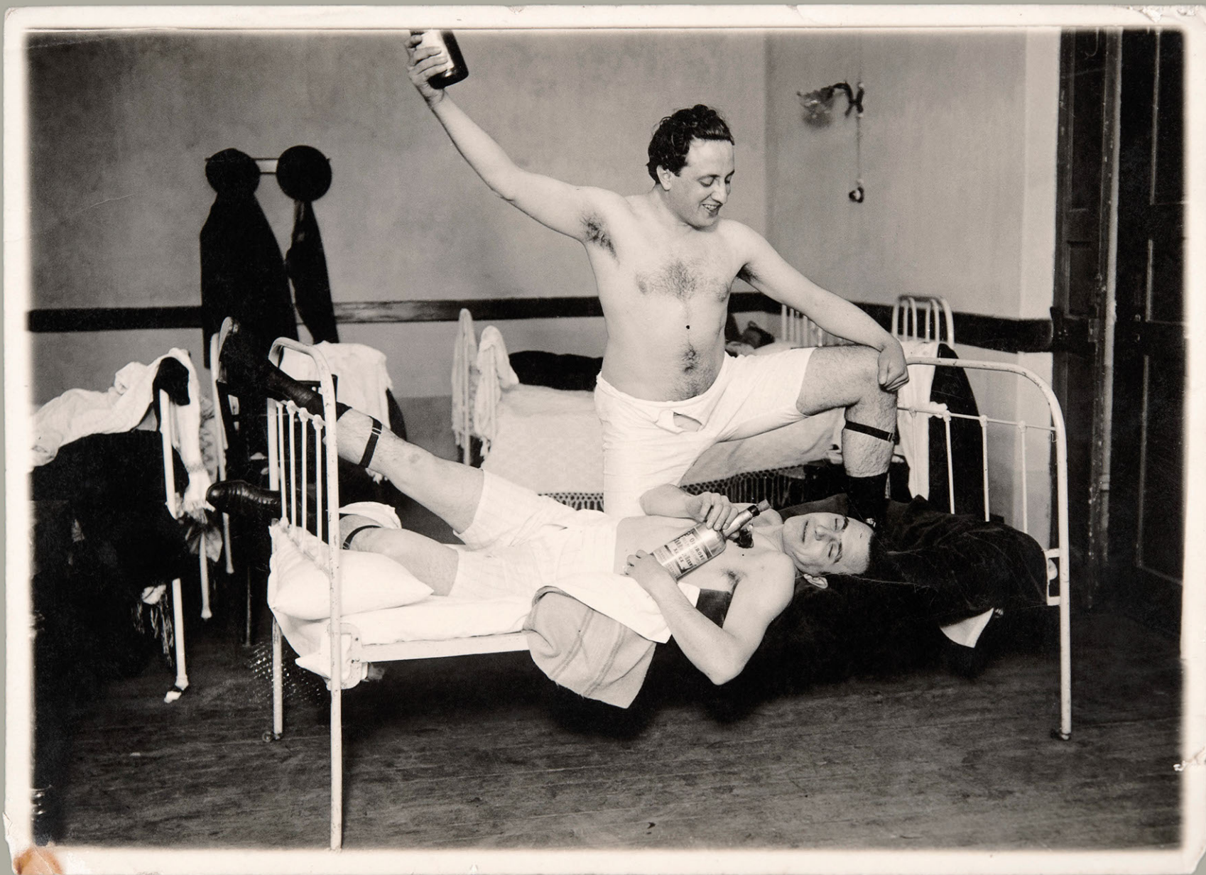
Troupe Ateniense. Arriba: Gerardo Matos Rodríguez. Buenos Aires, 1926.