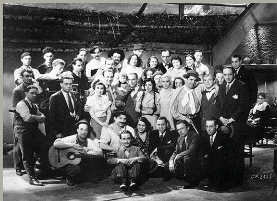
BECHO Y UN TANGO Centro de Fotografía de Montevideo Museo y Centro de Documentación de Agadu