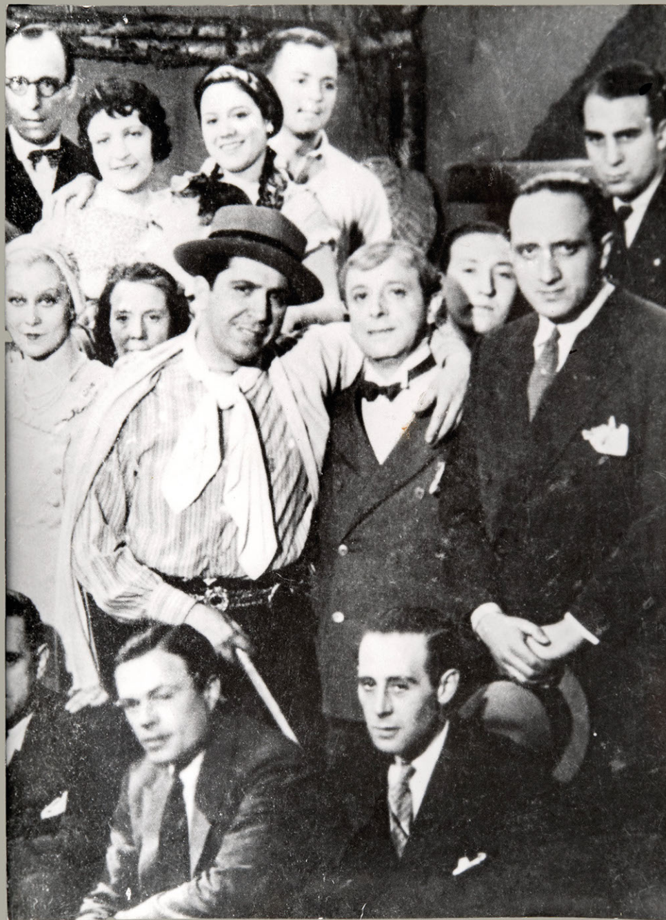
Rodaje de la película Las Luces de Buenos Aires. A la izquierda: Carlos Gardel; a la derecha: Gerardo Matos Rodríguez. Joinville, Francia. Año 1931.