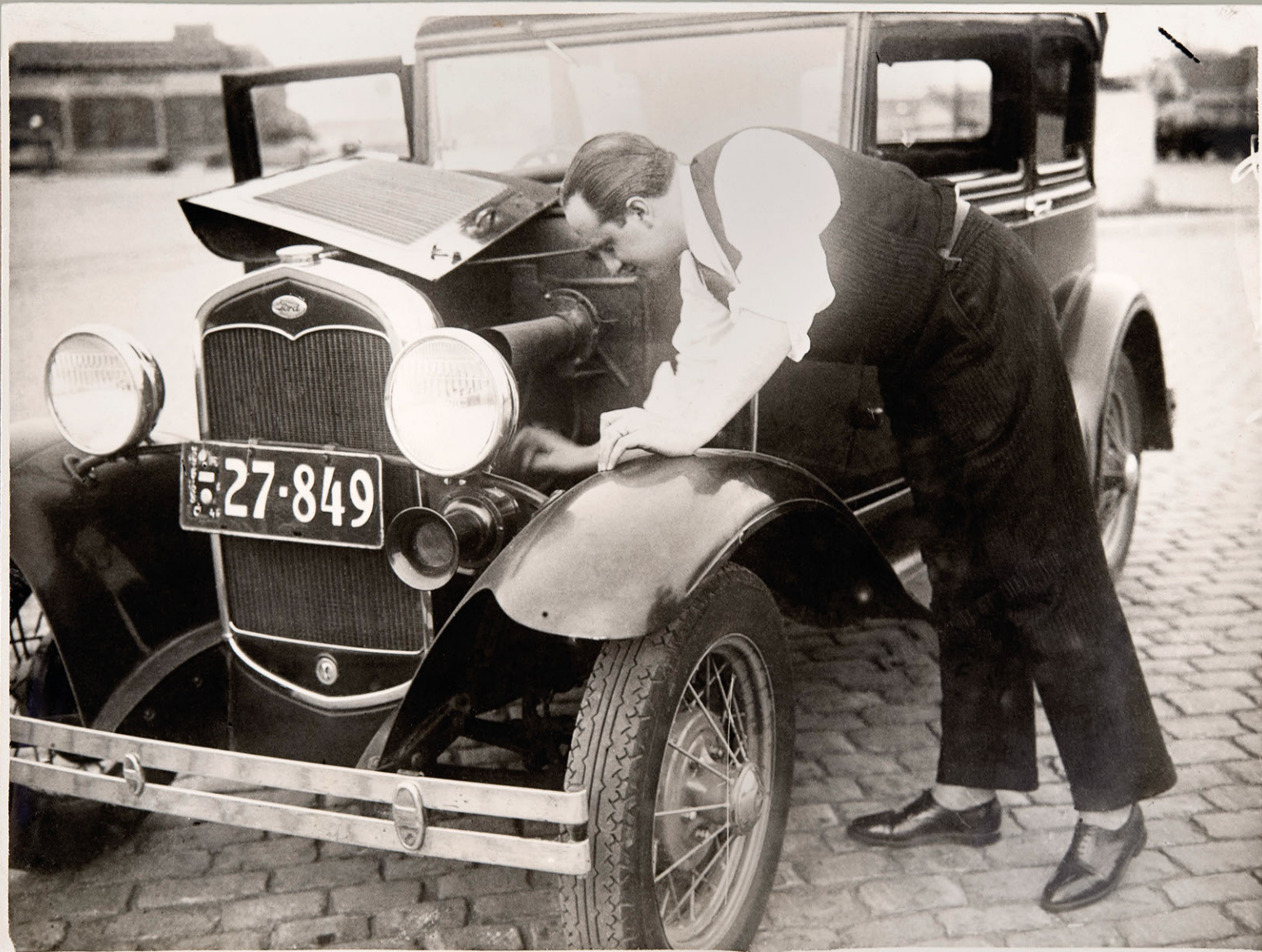
Gerardo Matos Rodríguez. Década del 30.