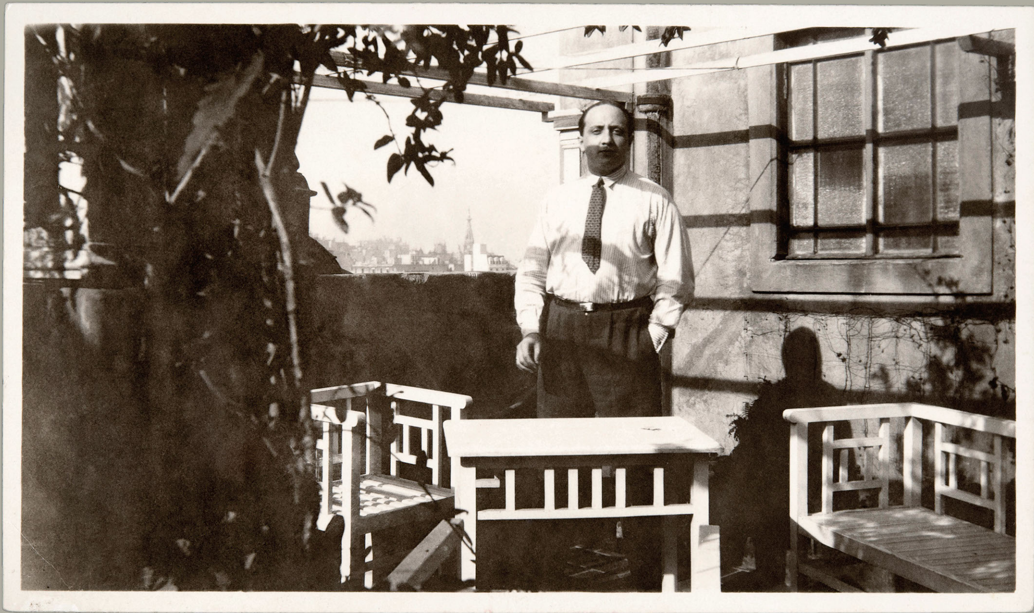
Gerardo Matos Rodríguez, en su apartamento de Buenos Aires. Década de 1930.