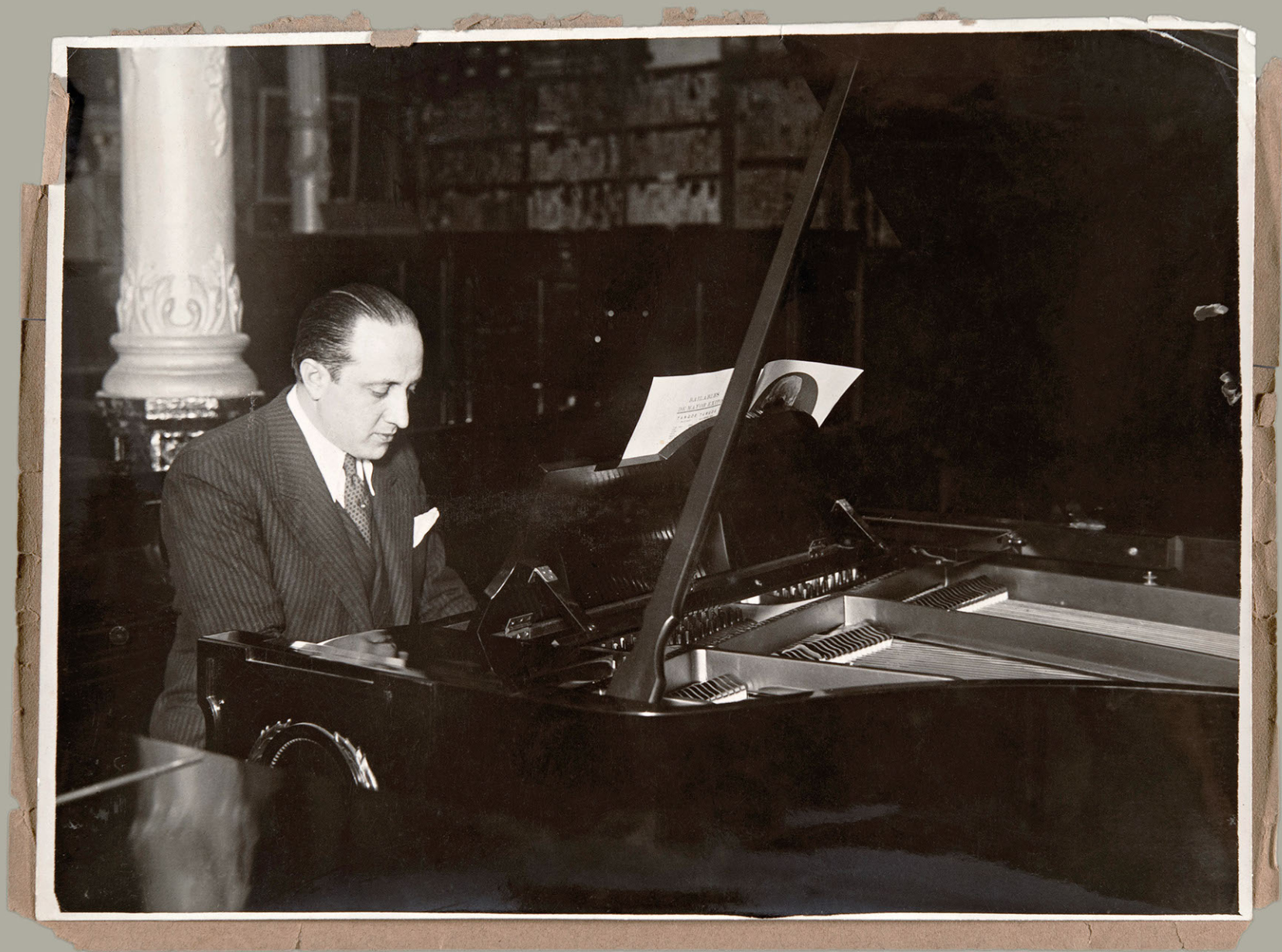
Gerardo Matos Rodríguez. Década de 1930.