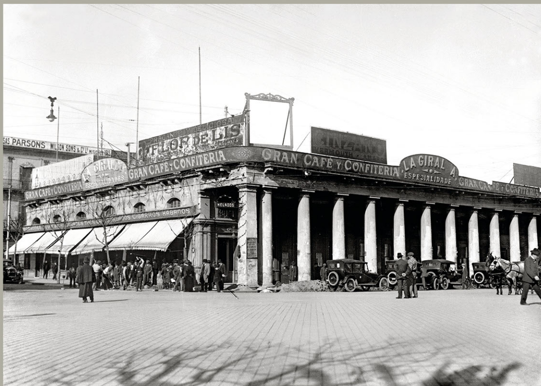
Café y Confeitería La Giralda. Esquina de la Avenida 18 de Julio y la Plaza Independencia. Año 1920 (aprox.). (Foto: 126FMHB.CDF.IMO.UY - Autor: S.d./IMO).